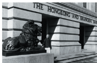
铜狮史提芬和施迪坐镇 香港及上海的汇丰总行大厦接近一世纪