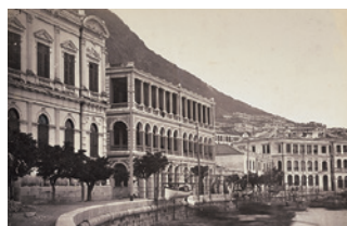
位于香港皇后大道中1号获多利行的 第一代汇丰总行大厦