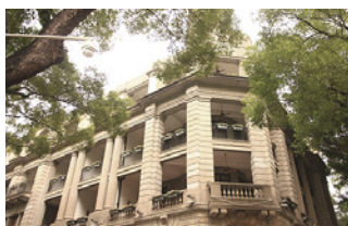
广州沙面大街汇丰旧址